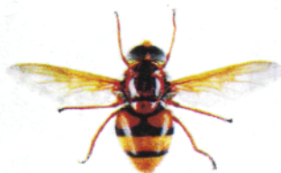
Volucelle zonée, Volucella zonaria

De nombreuses mouches (Diptères) peuvent ressembler à des guêpes ou des frelons. Mais à la différence de ceux-ci elles ne possèdent qu'une seule paire d'ailes au lieu de deux. Leurs yeux sont généralement beaucoup plus globuleux et leurs antennes plus courtes.