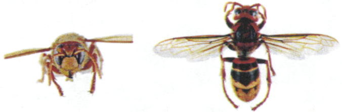
Frelon d'Europe, Vespa crabro

Le frelon d'Europe , Vespa crabro , a l'abdomen à dominante jaune clair, avec des bandes noires. Sa tête est jaune de face et rouge au dessus. Son thorax et ses pattes sont noirs et brun-rouges. Les ouvrières mesurent entre 18 et 23mm et les reines entre 25 et 35.