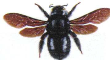
Xylocope ou abeille charpentière, Xylocopa violacea

L' abeille charpentière mesure entre 2 et 3 cm. C'est l'une des plus grandes abeilles européennes. Elle est entièrement noire avec des reflets bleu violacés. Elle construit son nid dans le bois mort et nourrit ses larves de pollen.