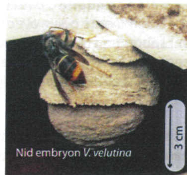
Nid embryon V. velutina

Au printemps, chaque reine fondatrice construit seule son nid dans un lieu souvent protégé. Chez la plupart des guêpes le nid embryon ressemble à une petite sphère de 5 à 10 cm de diamètre avec une ouverture vers le bas. Chez les frelons, la colonie n'hésitera pas à déménager si l'emplacement ne convient plus (manque de place, de sécurité).