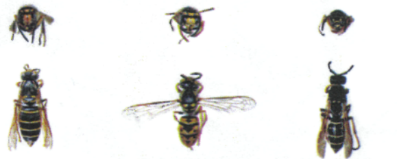
Guêpe des buissons, Dolichovespula media

Les guêpes sont plus petites que les frelons. Les ouvrières mesurent environ 15mm en fin d'été. Attention, une reine de guêpe peut dépasser légèrement 20mm, c'est-à-dire la taille du frelon asiatique représenté ici sans la tête. Au printemps les guêpes peuvent donc être plus grande que les premières ouvrières de frelon.