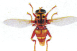
Milésie faux-frelon, Milesia crabroniformis