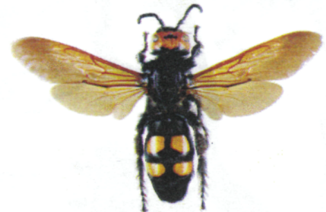
Scolie des jardins, Megascolia maculata flavifrons

La scolie des jardins fait partie des plus imposantes "guêpes" européennes. Elle est de ce fait fréquemment confondue avec le frelon asiatique. Sa pilosité est très épaisse. Son corps est noir brillant, sa tête est jaune sur le dessus et elle possède 4 zones jaunes et glabres sur l'abdomen. C'est un parasite de larves de gros Coléoptères (comme le Hanneton).