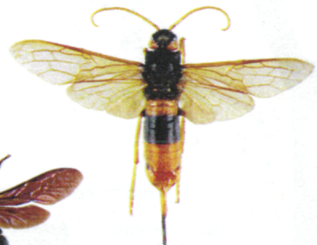
Sirex géant, Urocerus gigas

Le sirex géant est un Hyménoptère dont la larve se nourrit de bois. La femelle peut atteindre 4,5 cm, a une coloration proche du frelon asiatique, mais s'en distingue facilement par des antennes longues entièrement jaunes ainsi que par la présence d'une longue tarière lui permettant de pondre dans le bois. Cet insecte est inoffensif.