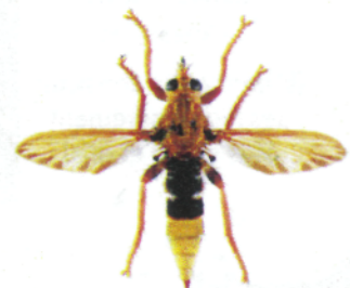
Asile frelon, Asilus crabroniformis