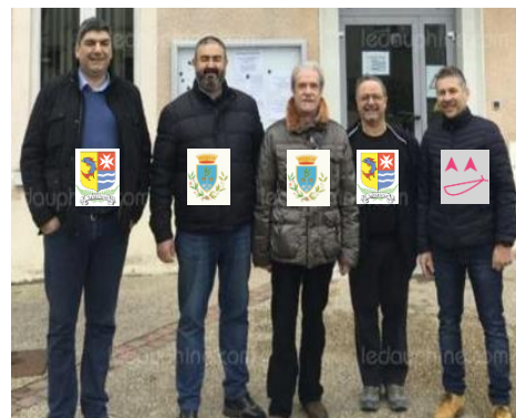
Valencin et Castagnito rassemblées pour la 1 ère fois