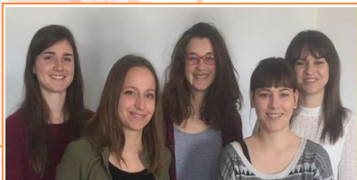
5 des 6 étudiantes susceptibles de vous interviewer à l'école, dans la rue, etc...

L'inscription sera définitive sur présentation de tous les documents. Les «nouveaux arrivants» doivent également se faire connaître et devront de plus fournir un certificat de radiation délivré par l'école d'origine dans le cas d'un enfant déjà scolarisé en 2016-2017.