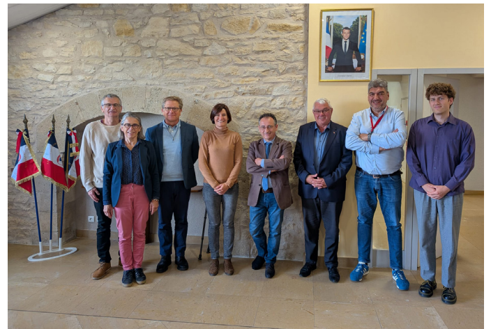
Réunion en mairie pour le label « Village d'Avenir » avec Monsieur le Sous-Préfet Rémy Darroux