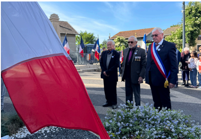
Commémoration du 8 mai 1945